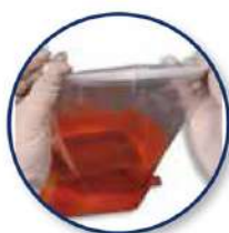
Bolsas de transporte Ver páginas 320 y 368