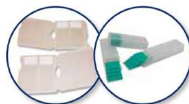
Cajita para envío portaobjetos Ver página 255.